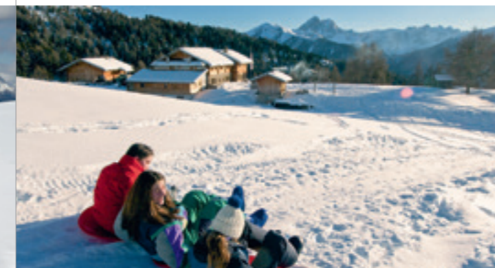
Rodelspaß und Einkehr auf der Kreuzwiesental / Slittino sulla malga Kreuzwiese

Bar/Rest./Rist. Rosental 0472 413 800 Bar Plaickner 0472 413 724 Bar/Rest./Rist. Lüsnerhof 0472 413 633 Bar Verena 0472 414 030 Bar Autoservice Kaser 0472 413 930 Gasthof Tulperhof 0472 413 760