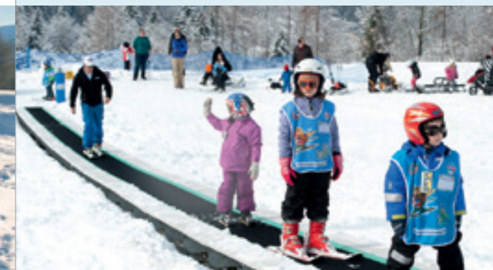
Der Zauberteppich beim Skilift Rungg / Il tappeto magico all'impianto sciistico Ronco

Kontakt/Contatto: Autoservice 0472 413 930