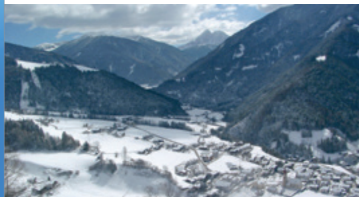
Malga Lüsner-Rodenecker Alm

Wenn der Winter die Almwiesen in seine weiße Pracht kleidet, bietet sich die stille Lüsner Alm (1.800 – 2.300 m) zum Schneeschuhwandern, Langlaufen, Rodeln und für Wanderungen im Schnee an. Sie hat mehrere sanfte ungefährliche Gipfel und ist deshalb wohl das idealste Gebiet für Schneeschuhwandern in den gesamten Dolomiten.