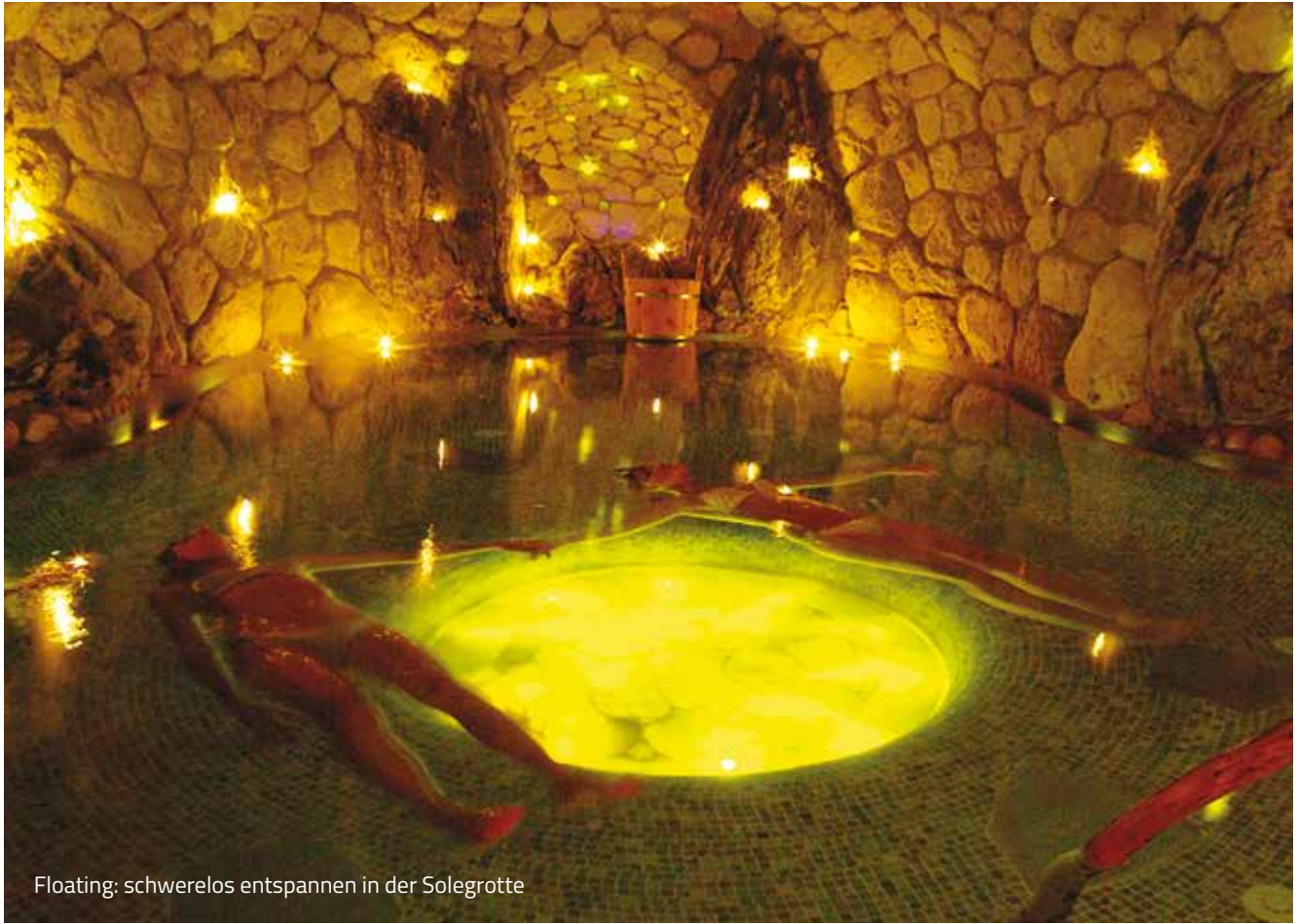
Floating: schwerelos entspannen in der Solegrotte