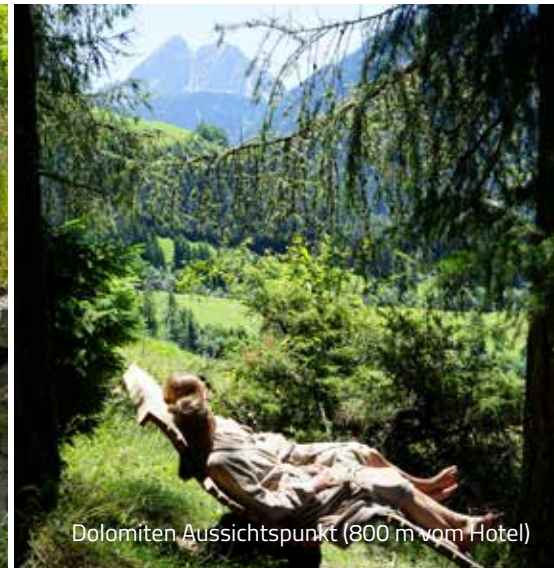
Dolomiten Aussichtspunkt (800 m vom Hotel)