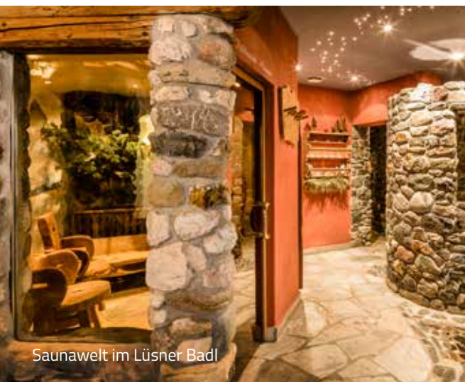
Saunawelt im Lüsner Badl