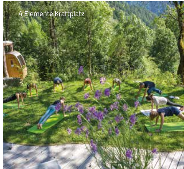
4 Elemente Kraftplatz

Auf Wunsch können auch private Yogastunden gebucht werden: Kosten 47,00 €